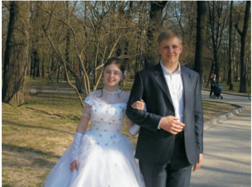
Прогулка после венчания