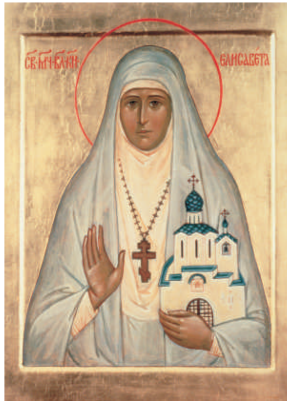
Преподобномученица Великая Княгиня Елисавета

В нашем храме совсем недавно начало работать сестричество, названное в честь святителя Николая Свято-Никольским. Это движение только зарождается, только формируется и укрепляется. Если вспомнить историю нашего храма, то появление сестёр милосердия станет не просто случайностью, а всё же благословением Божиим, так как на освящении храма в 1916 году присутствовала сама основательница Марфо-Мариинской обители милосердия Великая Княгиня Елисавета Феодоровна, причисленная к лику святых; а сам храм являлся первым построенным в России храмом-памятником Первой мировой войны, все тяготы и последствия которой несли на своих плечах сестры милосердия.