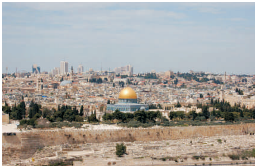
Вид на Храмовую гору и Старый город Иерусалим

По возвращении домой при домашнем чтении Святого Евангелия постепенно нарастало желание прийти сюда своими ногами, не на автобусе, и побыть и помолиться вволю, без ограничений. Найти Сионскую горницу – место Тайной вечери, место Сошествия Святого Духа на апостолов. Где-то здесь, в доме праведных Иоакима и Анны, родилась Божия Матерь. С прошлого раза осталась неудовлетворённость кратким заездом в Горненский монастырь, хотелось побыть там подольше, помолиться на службе.