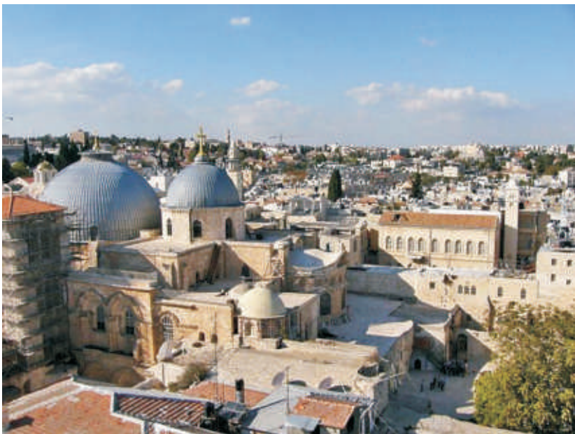
Храм Гроба Господня

Наутро мы пошли искать Гроб Господень через Яффские ворота по памяти, как в прошлый раз нас водил руководитель группы «Радонеж»: 2-й поворот налево, 1-й поворот направо, на Т-образном перекрёстке налево и сразу направо.