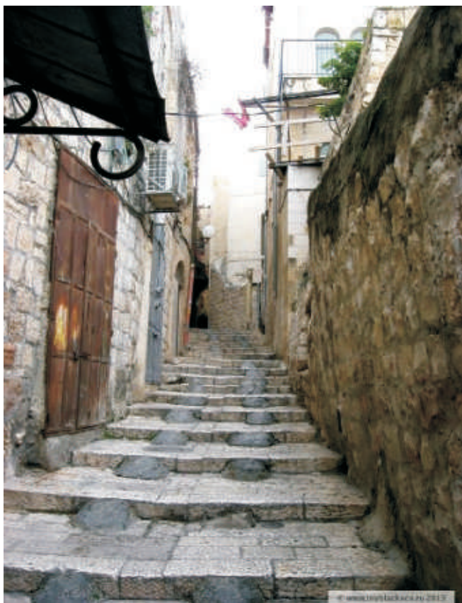
Via Dolorosa (Путь Страданий)

Via Dolorosa (Путь Страданий) привёл нас, уставших и голодных, к армянской церкви с небольшим кафе. Это место замечательно тем, что здесь, по преданию, к упавшему Христу подошла Его Мать. Барельеф над входом напоминает об этом событии.