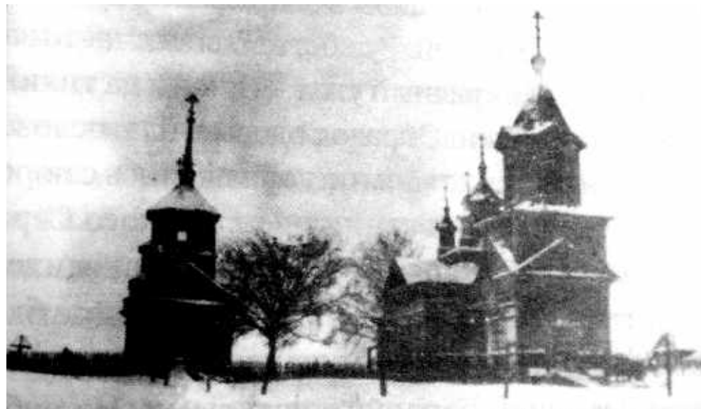
Храмы в Силёве. Фото советских лет.