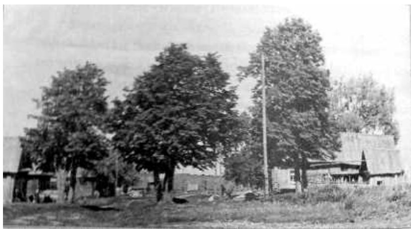
Село Силёво. Фото 1960-х гг.

Приходской листок Патриаршего подворья храма святителя Николая Мирликийского у Соломенной сторожки. Выходит один раз в месяц. Тираж 500 экз. Подписано в печать 20.09.14. Отпечатано в типографии ООО "АСТРА-ПОЛИГРАФИЯ" Распространяется бесплатно. © Храм святителя Николая Мирликийского у Соломенной сторожки